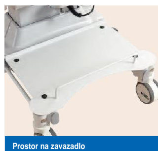
Prostor na zavazadlo