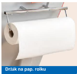
Držák na pap. rolnu