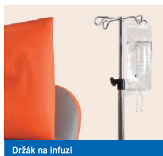
Držák na infuzi