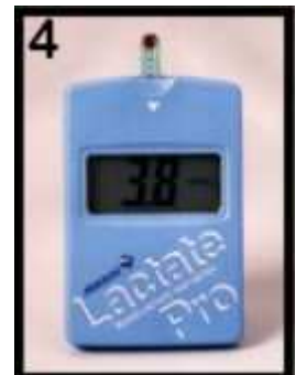
4 Výsledek měření je do 60 vteřin