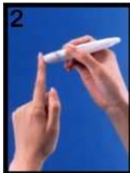
2 Odeber krev