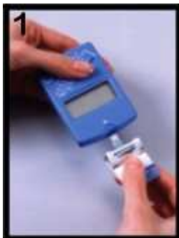
1 Vlož svlečený testovací proužek do přístroje