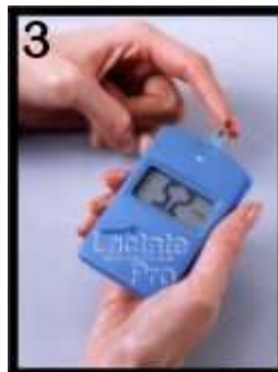
3 Krev je automaticky nasána a začíná měření